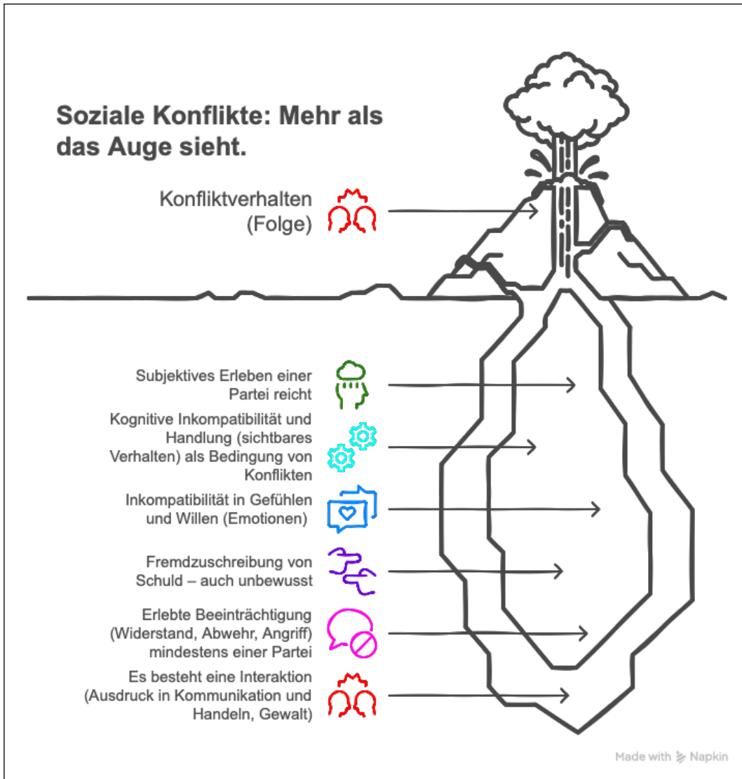
Abb. 2: Annahmen Glasls zu sozialen Konflikten in einem Eisbergmodell

Friedrich Glasl erweitert die Definition und Abgrenzungen des (sozialen) Konflikts um sein Phasenmodell der Eskalation . Es verbindet seine Auffassung, dass sich Eskalationsdynamiken nicht nur auf einer makrosozialen, sondern auch auf „mikro- und meso-sozialer“ Ebene darstellen lassen (Glasl, 2024, S. 203f.). 7 Den Nutzen des Modells beschreibt Glasl (2024, S. 204) wie folgt: „Es ist für die Auswahl von Interventionsstrategien der Konfliktbehandlung wichtig, zu erkennen, bis zu welchem Grad die Konflikte bereits angewachsen sind.“ Das Phasenmodell der